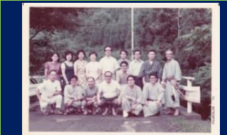
S48 篁山会合宿 (相模湖畔民宿)