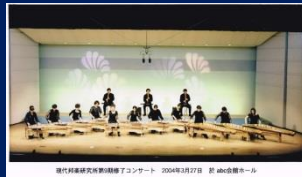
H16 現代邦楽研究所第9期 修了コンサート