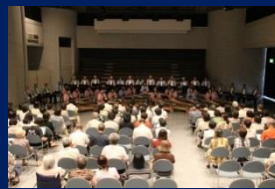
6月花巻公演<H25 ドルチェ邦楽合奏団>8月周年記念演奏会