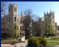
H24 シカゴ北イリノイ大学公演