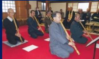
H27 虚無僧研究会 (新宿・法身寺)