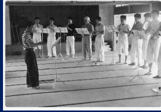
S36 大学尺八部合宿 (霞ヶ浦)