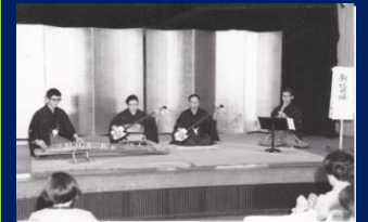
S44 「春秋会」5周年 (東京証券会館)