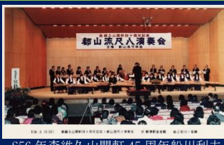
S56 年森維久山開軒 45周年船川利夫作曲「寂靜」箏ソロ 小泉栄子/尺八ソロ 森 (大阪郵便貯金会館)