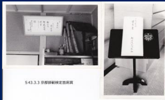
S43 京都師範検定首席賞受賞