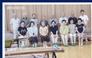
H27 大学尺八部 0B 会合宿