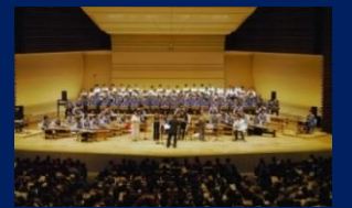
(東京文化会館大ホール)