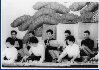
S35 大学尺八部発表会山川園松社中